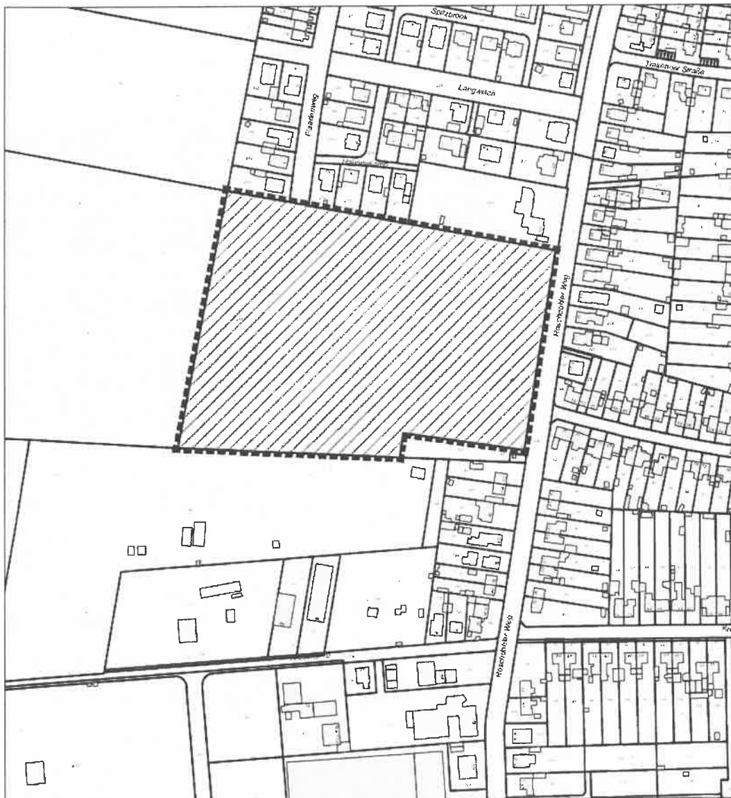
Übersichtsplan o. M

FÜR DAS GEBIET WESTLICH ROSCHDOHLER WEG / NÖRDLICH KREUZ- KAMP