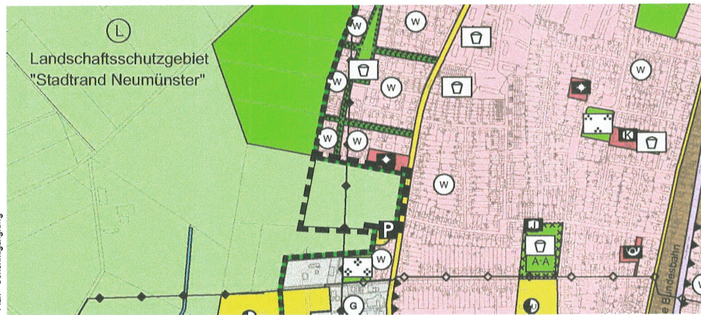
Bisherige Darstellung im Flächennutzungsplan 1990