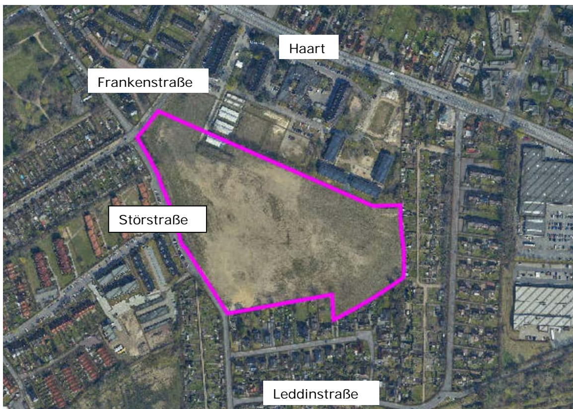
Luftbild aus 2021; GeoBasis_LVermGEO SH, Phoenix.

Insgesamt war der südliche Teil des Kasernengeländes als städtebaulicher Misstand zu klassifizieren. Aus diesem Grund wurde in den Jahren 2018/19 eine vollständige Beräumung der gesamten Fläche durchgeführt. Zudem wurden vorhandene Altlasten saniert und Bodenverunreinigungen ausgetauscht. Auch vereinzelte Grünstrukturen wurden in diesem Zuge beseitigt, um eine neue Nutzung der Fläche vorzubereiten. An der Störstraße ist eine Baumreihe verblieben, die ortsbildprägenden Charakter aufweist und in die Planung einbezogen wird.