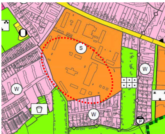
Flächennutzungsplan 1990, Auszug

Das Plangebiet ist im gültigen Flächennutzungsplan (FNP) 1990 als Sonderbaufläche dargestellt. Eine Änderung in Wohnbau- und Grünflächen ist erforderlich.