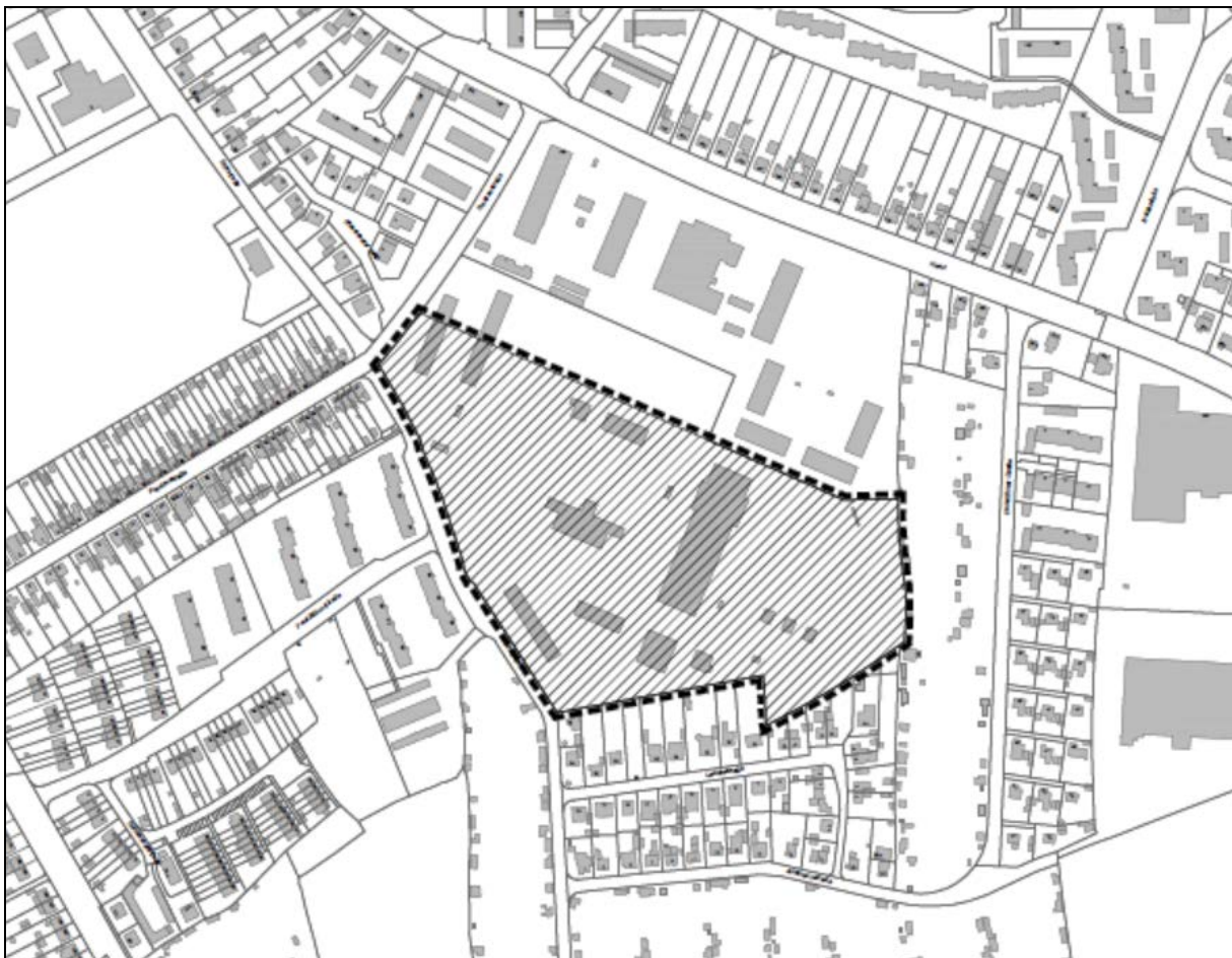
Übersichtsplan o. M.

FÜR DAS GEBIET DER EHEMALIGEN SCHOLTZ-KASERNE SÜDLICH DES LANDESAMTES FÜR ZUWANDERUNG, WESTLICH DER KLEINGARTENANLAGE „AM HAART“, NÖRDLICH DER WOHNBEBAUUNG AN DER LEDDINSTRASSE, NORDÖSTLICH DER STÖRSTRASSE UND SÜDÖSTLICH DER FRANKENSTRASSE IM STADTTTEIL BRACHENFELD-RUTHENBERG