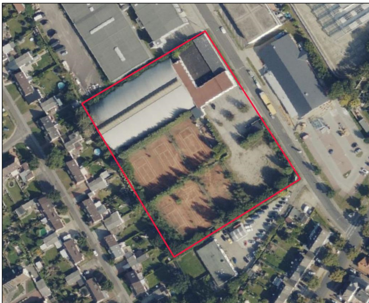
Abbildung 1: Grobe Abgrenzung des B-Plans Nr. 181 der Stadt Neumünster

Bei der Ortsbegehung am 28.11.2022 war der Abbruch der ehemaligen Sporthalle sowie der übrigen Gebäude innerhalb des Plangebiets bereits durchgeführt worden und es dauerten die Gehölzrodungen an (s. Deckblattfoto).