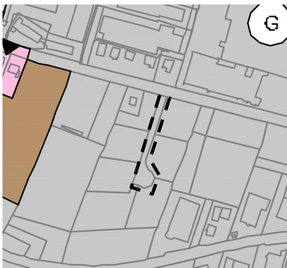
Ausschnitt aus dem geltenden FNP, o.M.

Aus der geltenden Landes- und Regionalplanung ergeben sich ebenfalls keine Einschränkungen für die Planung.