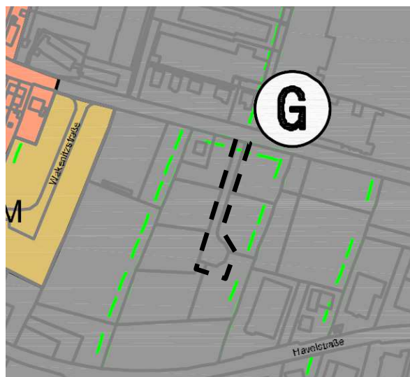
Ausschnitt aus dem Landschaftsplan, o.M.