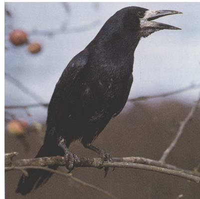
Die Saatkrähe ( Corvus frugilegus ) ist als erwachsenes Tier gut an ihrer weißen Schnabelwurzel von der sonst sehr ähnlichen, völlig schwarzen Rabenkrähe ( Corvus corone ) zu unterscheiden.

Eine heute verbreitete falsche Vorstellung ist, dass Saatkrähen Raubvögel und Nesträuber sind, die am Rückgang vieler Singvogelarten in den Städten schuld sind. Richtig ist vielmehr, dass sie mit ihren nächsten Verwandten - dem Kolkkraben, der Rabenkrähe, der Dohle, der Elster und dem Eichelhäher - selbst zur großen Familie der Singvögel gehören.