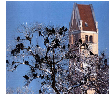
Überwinterer aus dem nordosteuropäischen Raum täuschen im Winter oft hohe Bestandszahlen vor. Im Frühjahr ziehen diese Vögel wieder in ihre Brutgebiete zurück.

Schleswig-Holstein ist ein Brutverbreitungsschwerpunkt der Saatkrähe in Deutschland. Seit Kriegsende beherbergt das nördlichste Bundesland etwa 2/3 des Bestandes aller alten Bundesländer. Allerdings hat sich auch hier innerhalb von nur zwei Jahrzehnten der Bestand von etwa 16.000 Paaren (1954) auf wenig mehr als 8.400 Paare (1974) aufgrund intensiver Verfolgung nahezu halbiert. Das zeigt die besondere Verantwortung Schleswig-Holsteins für den Erhalt dieser Vogelart.