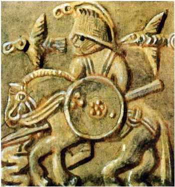
Auf einem 1000 Jahre alten germanischen Helm wird hier der Kriegsgott Odin in Begleitung zweier Raben dargestellt.

"Die Bosheit war sein Hauptplaisir, drum - spricht die Tante - hängt er hier."