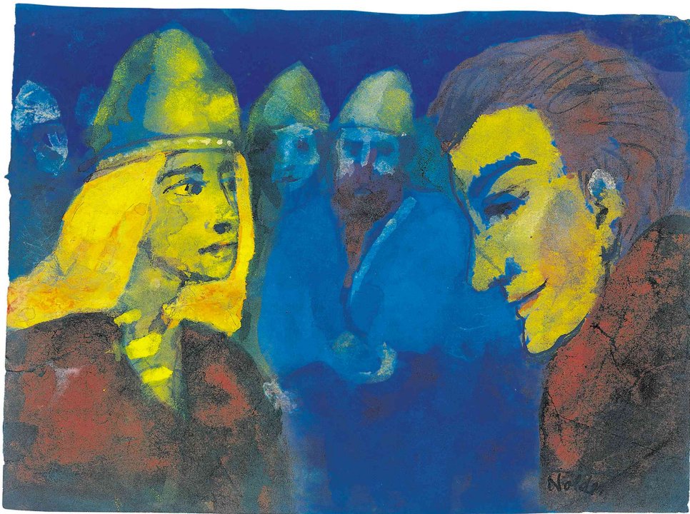
Nordische Heldenwelt, mit Expressionisten-Augen gesehen: Nolde „Herrin und Fremdling“ von 1938

Julian Assange hat immer nur für sich gespielt und wählte sich auf Augenhöhe mit den Mächtigen der Welt, denen er es zeigen wollte. Die Dokumente, die ihm zugespielt wurden, betrachtete er nicht als Vehikel der Wahrheitssuche, sondern als Instrument der politischen und persönlicher Machtausübung. Dass er zuletzt, kurz vor seiner Festnahme, angeblich kompromittierendes Material über den ecuadorianischen Präsidenten Lenin Moreno veröffentlichte, passt ins Bild. Selbst wenn diese Dokumente skandalträchtig waren, was durchaus der Fall sein kann – durch sein Verhalten hat Assange im Laufe der Jahre sämtliches Material kompromittiert, das er herausgibt. Ohne ihn ist Wikileaks besser dran und könnte vielleicht endlich werden, was es schon immer sein wollte. In dem man Assanges Asyl in der Botschaft beibehalten, einen Stein im Schuh besitzigt“, sagte Moreno. Ob er dabei den Schulh-Trock der Wikileaks-Gründer im Sinn hatte? MICHAEL HANFELD