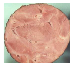
Bild 3 Formfleisch