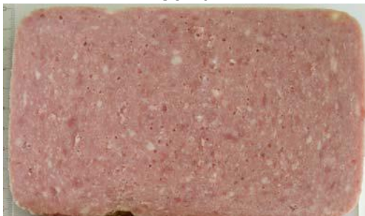
Bild 6 Schnittbild wie grobe Brühwurst Fleischanteil: 53 %; zugesetztes Wasser: 27 %