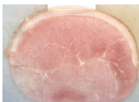
Bild 1 Hinterschinken

Dies gilt ebenso für Speisekarten, z.B. „Schinken-Pizza mit Formfleischvorderschinken, Tomaten, ...“, „Croque mit Formfleischvorderschinken...“, „Chefsalat mit Formfleischvorderschinken...“.