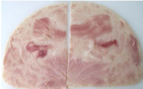
Bild 4 Schnittbild wie Sülze Fleischanteil: 56 %; zugesetztes Wasser: 30 %

Häufig finden in der Gastronomie für Pizza, Nudelgerichte oder Salate Erzeugnisse Verwendung, die einen grundlegend anderen Charakter als die oben beschriebenen Schinken, Vorderschinken und Formfleisch(vorder)schinken aufweisen. Die so hergestellten Erzeugnisse bestehen aus einer oft geleeartigen, schnittfesten Masse, in die kleinste bis deutlich sichtbare Fleischstücke eingebettet sind; oft weisen die Produkte auch ein brühwurstähnliches Aussehen auf (vgl. Bilder 4 bis 7).