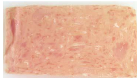
Bild 7 Schnittbild wie Brühwurst mit Einlage Fleischanteil: 56 %; zugesetztes Wasser: 27 %

Diese Produkte unterscheiden sich aber nicht nur gravierend in ihrem Aussehen von den Produkten, die sie ersetzen sollen, sondern auch in ihrem Fleischgehalt und in ihrem Geschmack.