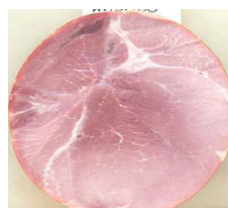
Bild 2 Vorderschinken