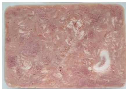
Bild 5 Schnittbild wie Schweinefleischkonserve Fleischanteil: 45 %; zugesetztes Wasser: 41 %