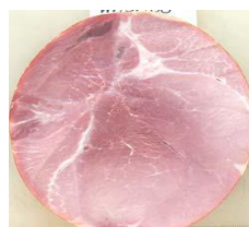
Bild 2 Vorderschinken