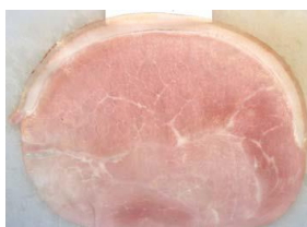
Bild 1 Hinterschinken

Dies gilt ebenso für Speisekarten, z.B. „Schinken-Pizza mit Formfleischvorderschinken, Tomaten, ...“, „Croque mit Formfleischvorderschinken...“, „Chefsalat mit Formfleischvorderschinken...“.