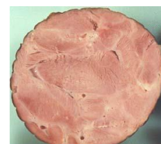
Bild 3 Formfleisch