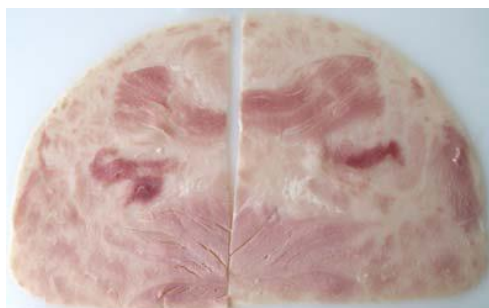
Bild 4 Schnittbild wie Sülze Fleischanteil: 56 %; zugesetztes Wasser: 30 %

Häufig finden in der Gastronomie für Pizza, Nudelgerichte oder Salate Erzeugnisse Verwendung, die einen grundlegend anderen Charakter als die oben beschriebenen Schinken, Vorderschinken und Formfleisch(vorder)schinken aufweisen. Die so hergestellten Erzeugnisse bestehen aus einer oft geleeartigen, schnittfesten Masse, in die kleinste bis deutlich sichtbare Fleischstücke eingebettet sind; oft weisen die Produkte auch ein brühwurstähnliches Aussehen auf (vgl. Bilder 4 bis 7).