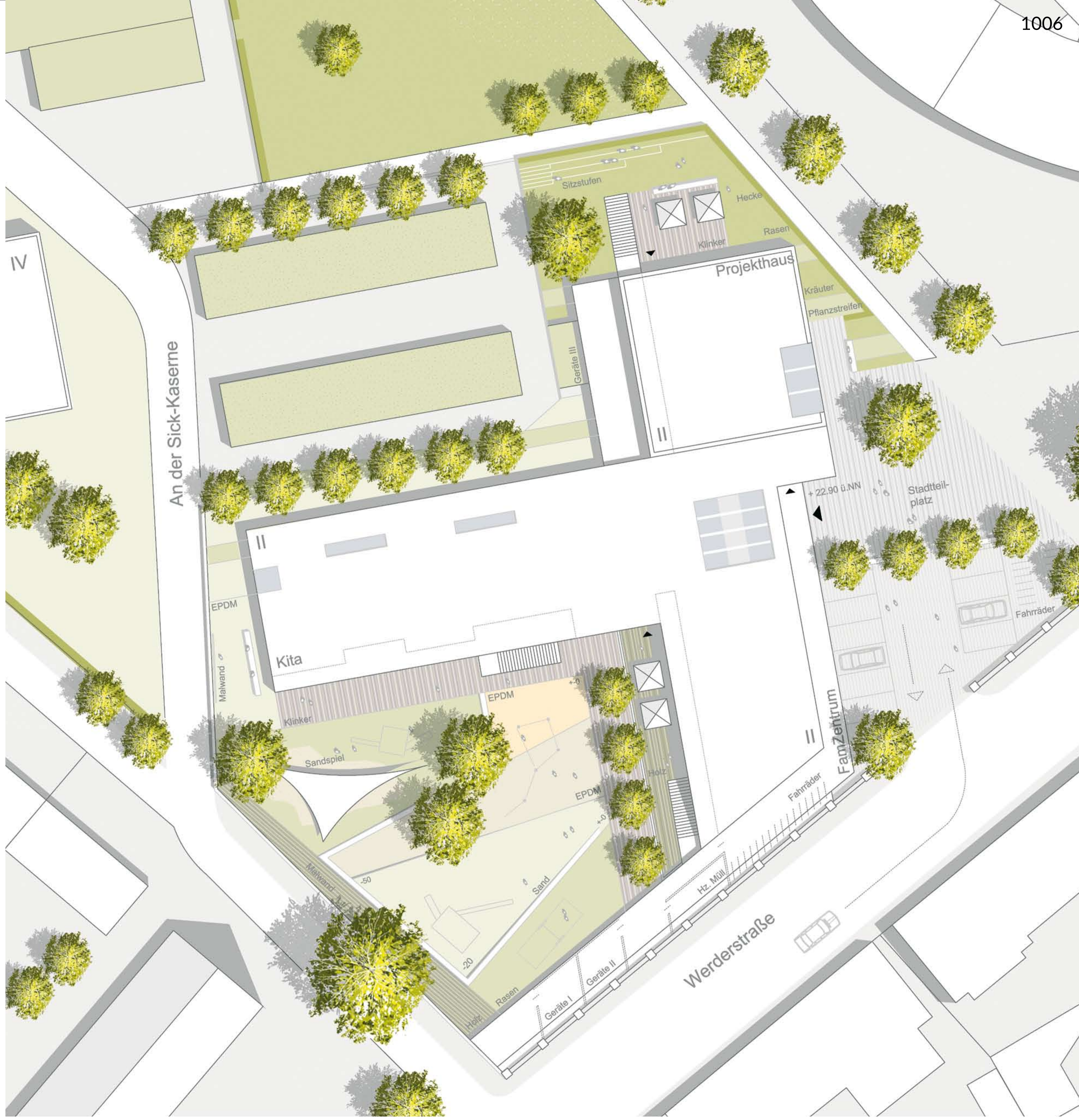
Lageplan _ M. 1:200