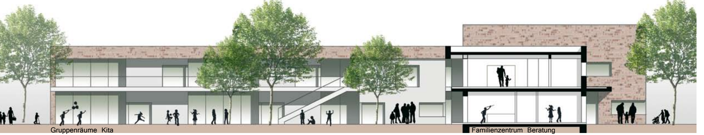
Schnittansicht von Süden _ M. 1:200