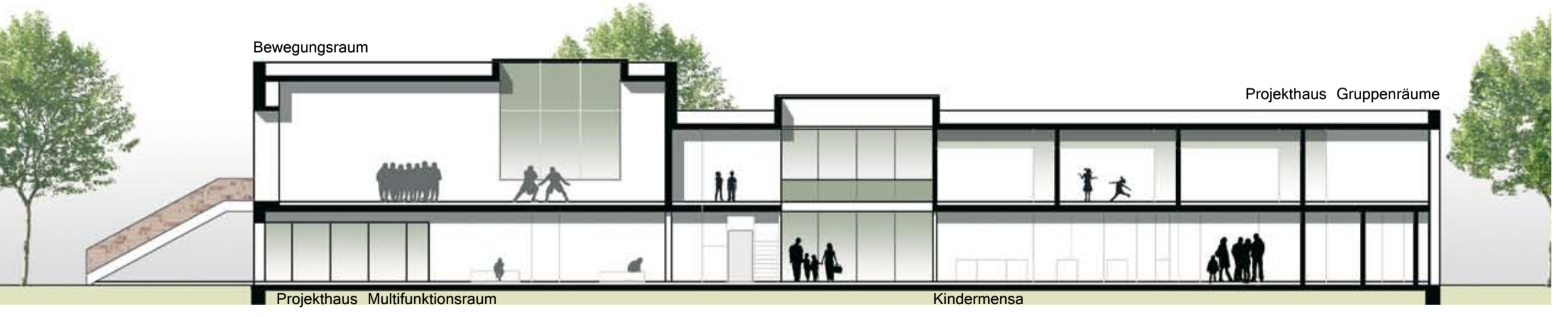
Schnitt _ M. 1:200