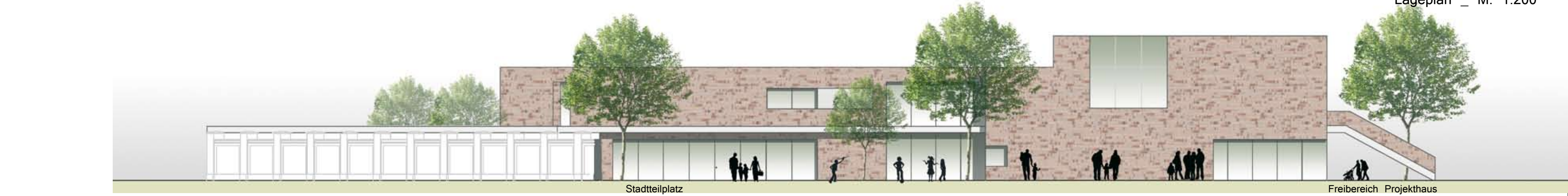
Ansicht von Osten _ M. 1:200